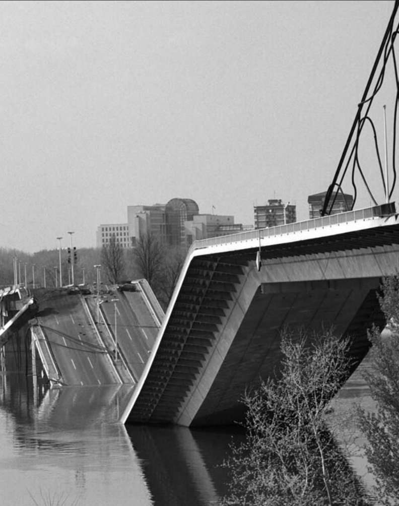
Срушен мост у Новом Саду