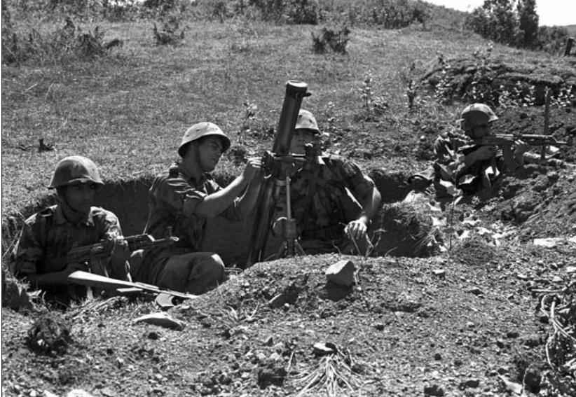
Положај минобацачлија ВЈ на граници према Албанији