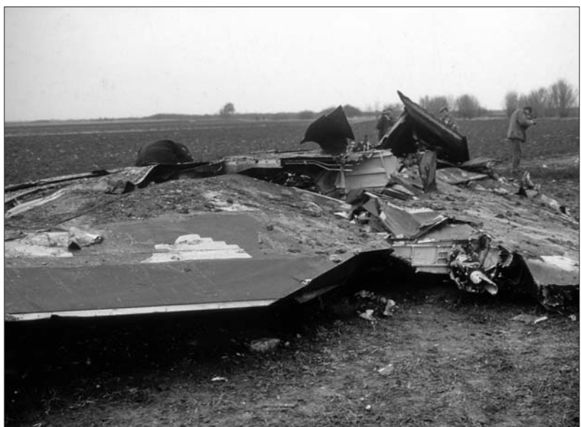
Невидљиви F-117 A у сремским ораницама