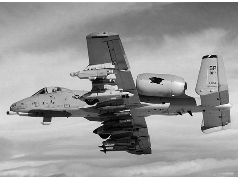
Пројектили с осиромашеним уранијумом испаљивани су из авиона А-10