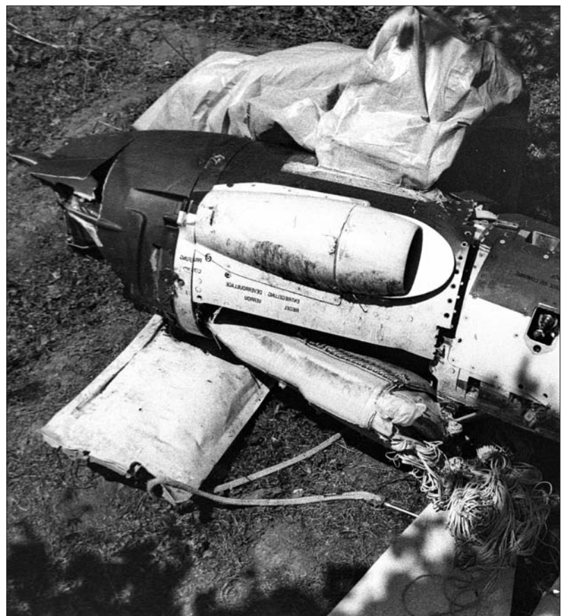
Остаци срушене беспилотне летелице