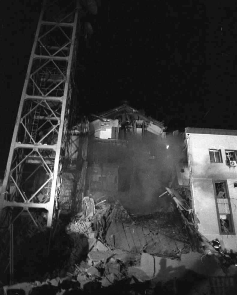
На нишану су се нашли и новинари ноћне смене РТС-а