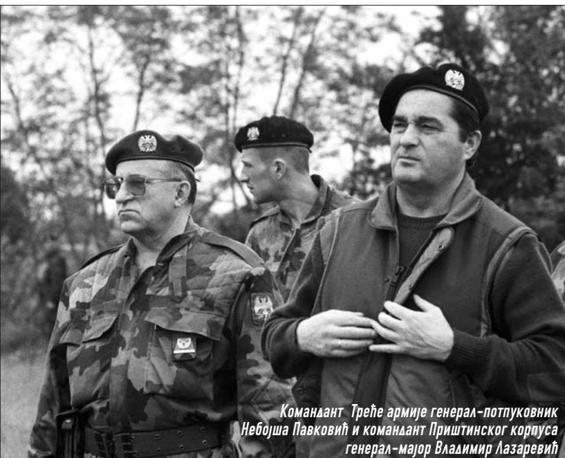
Командант Треће армије генерал-потпуковник Небојша Павковић и командант Приштинског корпуса генерал-мајор Владимир Лазаревић