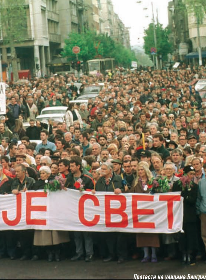
Протести на улицама Београда

Препуштена сама себи, већ разбијена група тзв. Ослободилачке војске Косова дели се у две мање групе, које се извлаче из борбе. Једна преко објекта Рунец (т.т. 932) ка комуникацији Ђенерал Јанковић – Качаник, а друга преко Љок-Махале ка селима Иваја и Качанику. У сукобу је убијено шест терориста, а двојица су заробљена и предата надлежним органима Министарства унутрашњих послова.