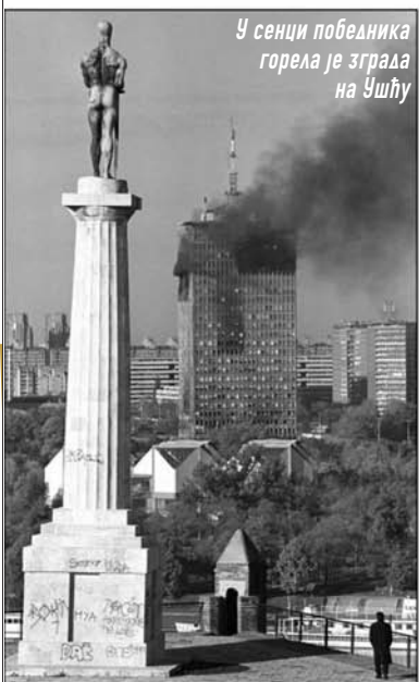
У сенци победника горела је зграда на Ушћу