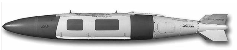
Контејнер у којима су се налазиле касетне бомбе