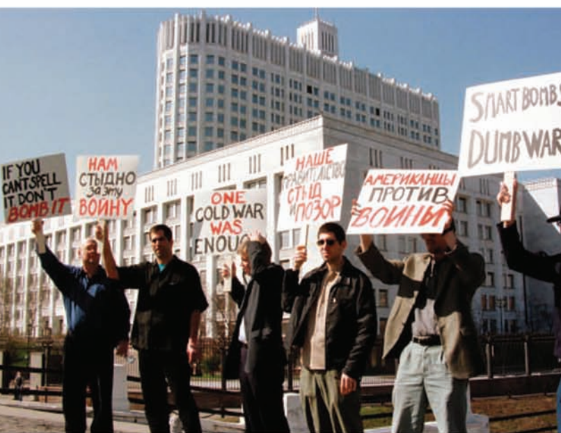
Широм света људи су спонтано реаговали на вест да Алијанса бомбардује суверену државу