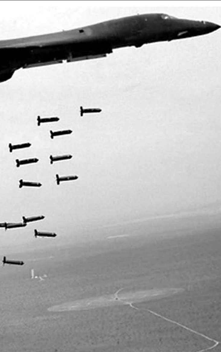
Авиони НАТО-а бомбардовали су с великих висина