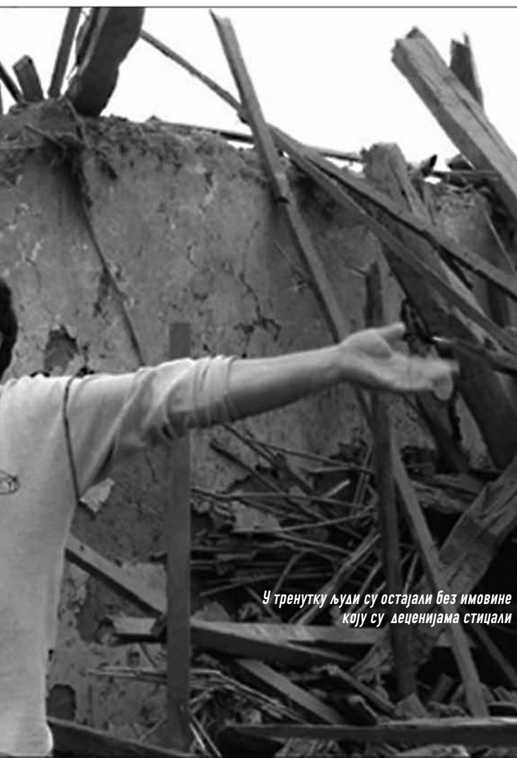
У тренутку људи су остајали без имовине коју су деценијама стицали