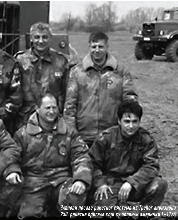
Чланови посаде ракетног система из Трејег дивизиона 250. ракетне бригаде који су оборили амерички F-117A