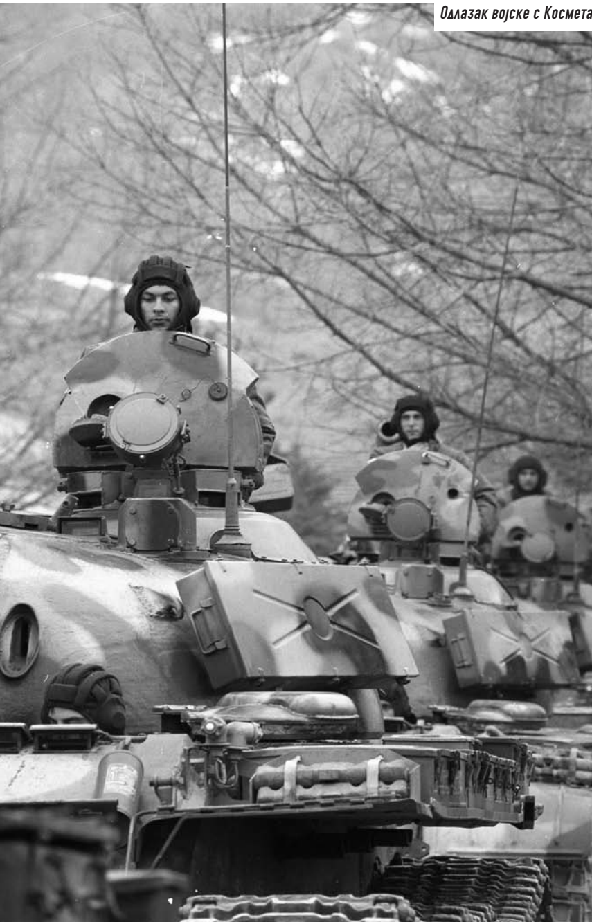
Одлазак војске с Космета

ности основних средстава ратне технике и врло скромним материјалним резервама.