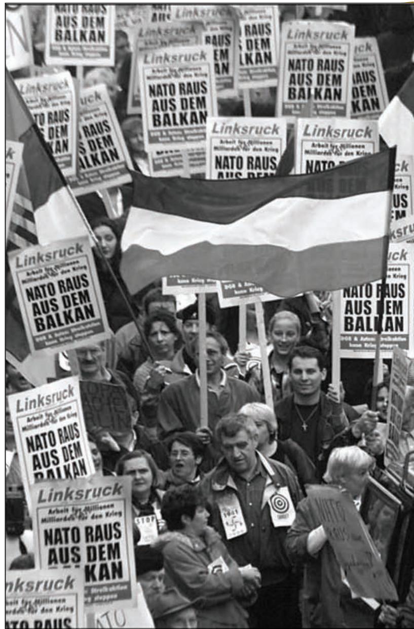
Широм света, становници су протестовали против бруталне агресије НАТО-а

Да би се избегло стратегијско изненађење, Штаб Врховне команде, уз одобрење или сагласност Врховног савета одбране и председника државе и Владе СР Југославије, отпочео је предузимање оперативних мера и поступака за припрему за одбрану од напада снага НАТО-а. Ту спадају мере за припрему система Цивилне заштите и спасавање становништва и материјалних добара од удара из ваздушног простора и ракетних удара крстарећих ракета. Требало је припремити, односно ставити у функцију систем осматрања, узбуђивања и јављања, довести у пуну заштитну функцију јавна склоништа;