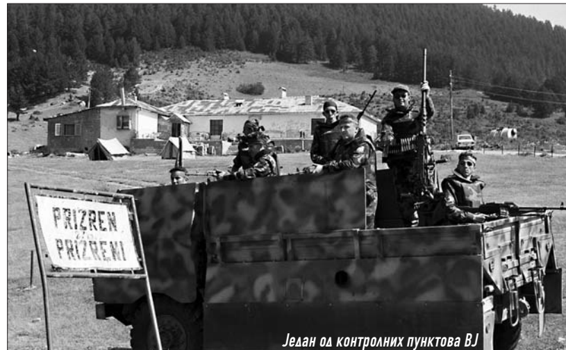
Један од контролних пунктова ВЈ