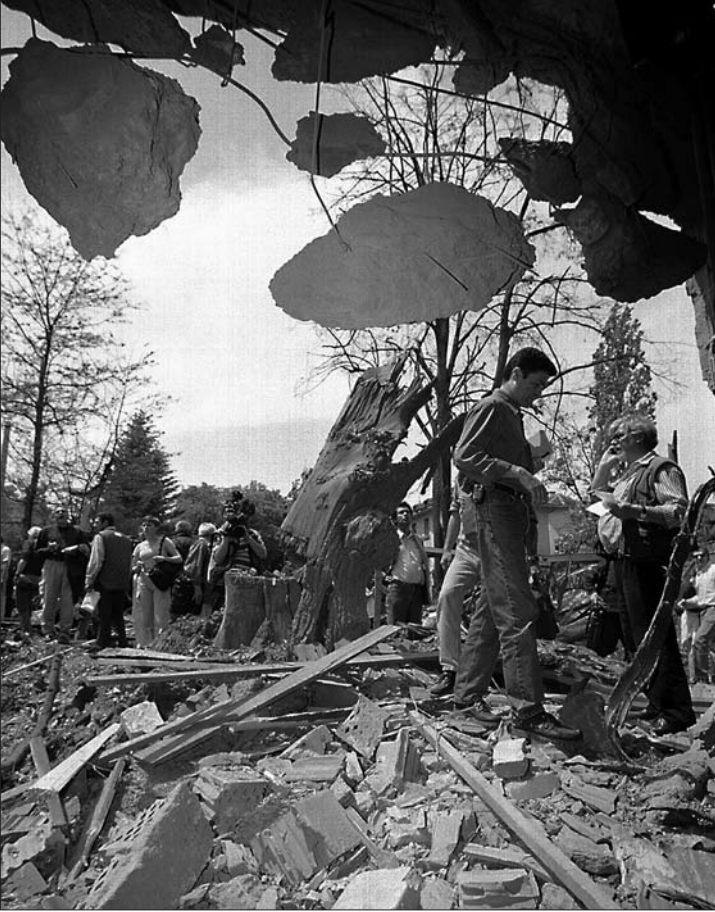
У агресији су употребљавани најразорнији пројектили