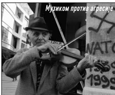
Музиком против агресије