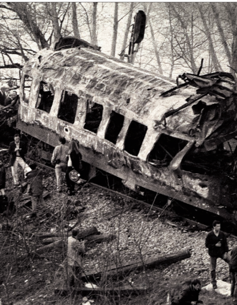
Призор из Грделичке клисуре

бригаде. Према изјавама званичних извора из Албаније агресор је имао око 800 погинулих.