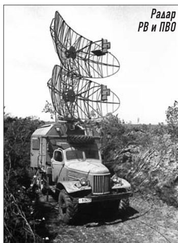
Радар РВ и ПВО