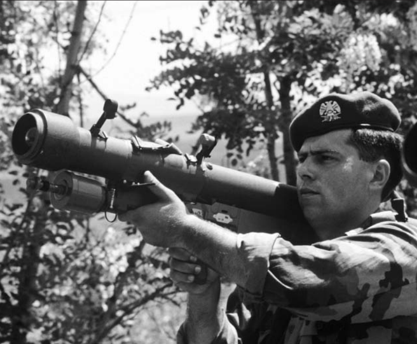
У засадном дејству