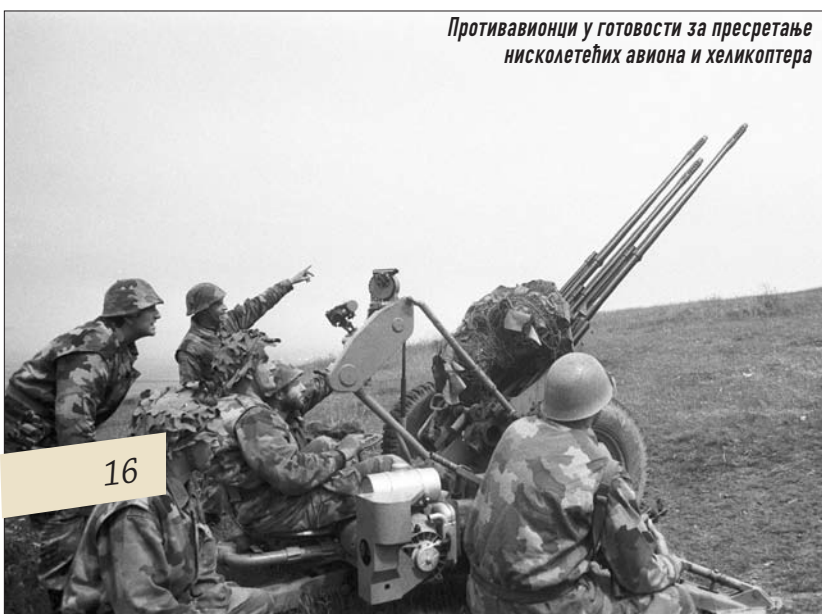
Противавионци у готовости за пресретање нисколетећих авиона и хеликоптера

Синоним за јунаштво и одлучност у одбрани територије СРЈ јесте одбрана у пределу Карауле „Кошаре“. На велики петак, 9. априла, више од 1.000 терориста, уз артиљеријску припрему, кренуло је на нешто више од 100 граничара који су се налазили око тог објекта спремни за одбрану. Они су одлучно одбијали напад за нападом. Био је то покушај НАТО-а да уз помоћ шиптарских терориста продре у дубину наше територије. А ишли су веома упорно, без обзира на то што су им саборци гинули.