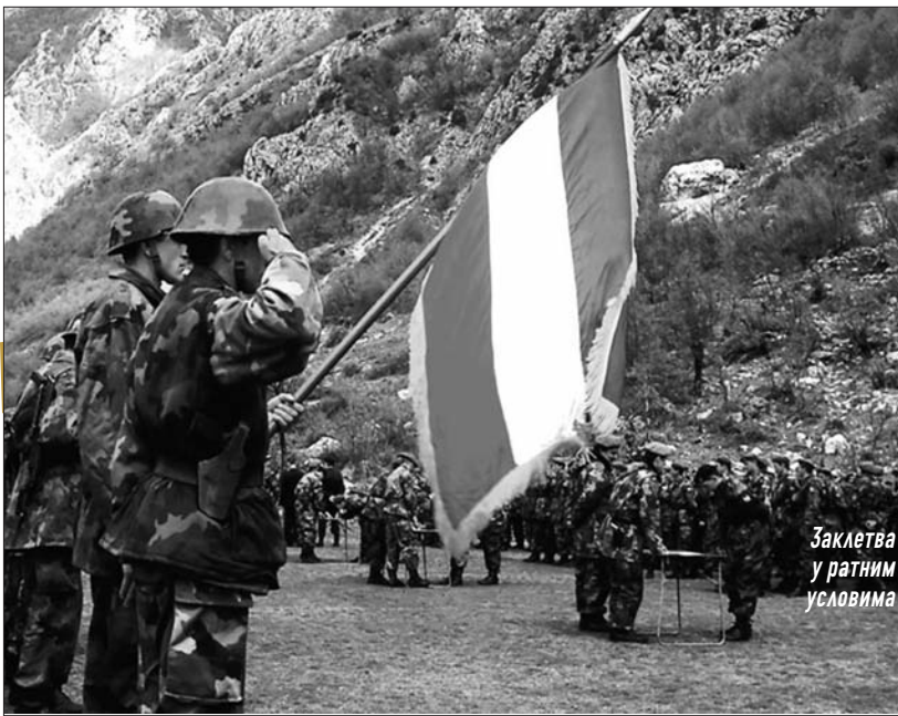
Заклетва у ратним условима

лима. А кренули смо из Грачанице, централног дела Косова. Дошло је до стабилизације одбране, до општег појачаног расположења и ми смо тада, сви који смо се нашли на том делу фронта, прећутно донели одлуку да ћемо бранити Србију по сваку цену. Одлука нигде није била написана. Нисмо одлучивали на основу тога од кога се бранимо, већ које светиње бранимо. Пре свега хиљаде војника, у другом појасу одбране, становништво, бранимо Космет и Србију.”