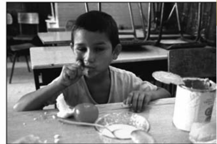
Призори из бомбардованих школа