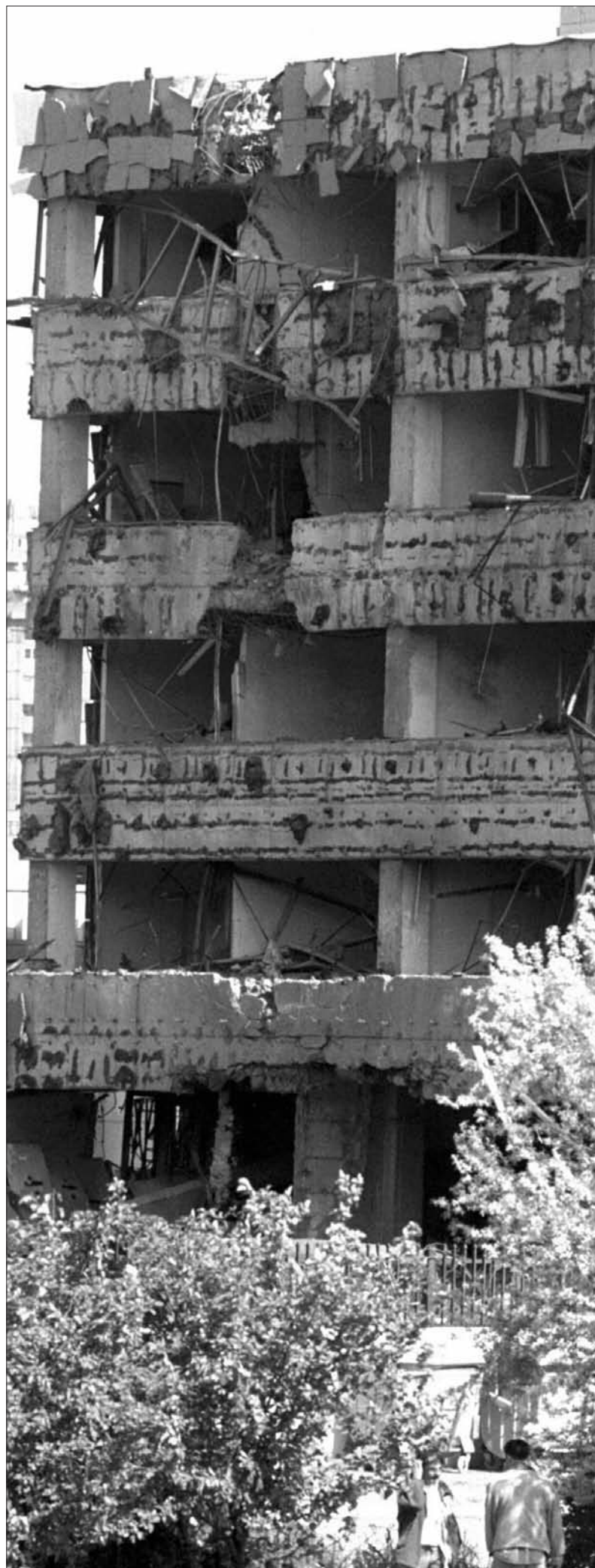
На мети се нашао и кинеска амбасада

Авијација НАТО-а с висине је разарала и термоелектране, далеководе, разводна постројења. Уједно, лишавали су народ воде, угрожавали бебе у инкубаторима, болеснике на дијализи и на зрачењима. При том, дејство на електроенергетски систем прогласили су легитимним с војне тачке гледишта, а додатне последице квалификовали су као споредну штету. Циљ им је био, сами тврде, „умањивање квалитета живота“ и „подривање морала“.