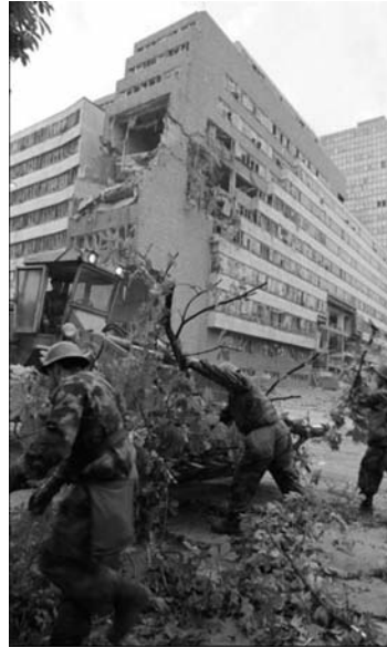
Порушена зграда Генералштаба

Страни новинари су стигли на лице недеља. Једни су плакали, други замуцкујући слали извештаје, а неколицина је упорно понављала питање да ли је то сигурно био цивилни воз.“