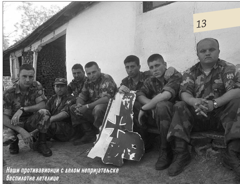
Наши противавионци с делом непријатељске беспилотне летелице

С обзиром на начин како је агресија почела и чињеницу да нису поштоване одредбе међународног хуманитарног и ратног права, НАТО је агресијом на СРЈ извршио злочин против мира и злочин против цивилног становништва.