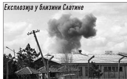
Експлозија у близини Слатине