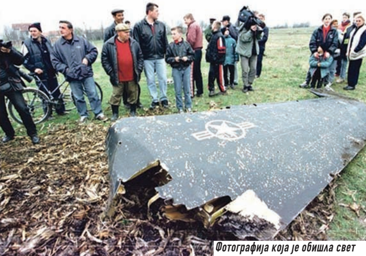
Фотографија која је обишла свет