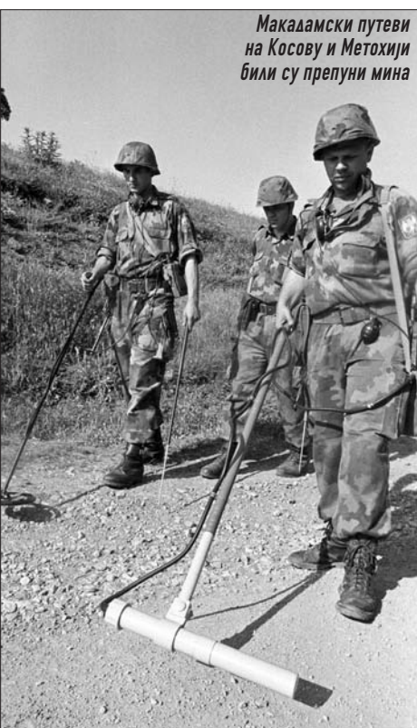
Макадамски путеви на Косову и Метохији били су препуни мина