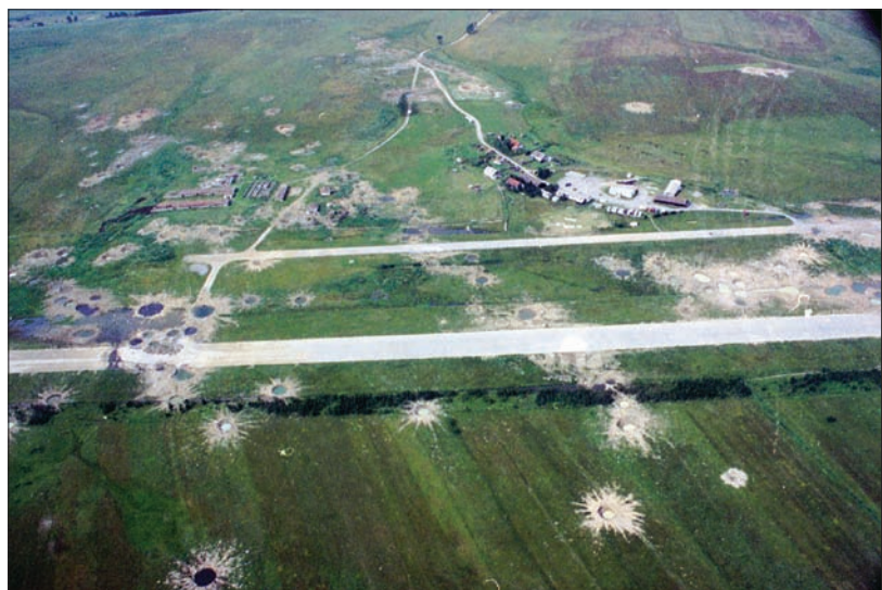
Западни војни савез немилосрдно је бомбардовао наше аеродроме